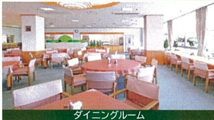
ダイニングルーム