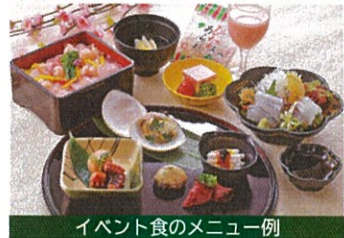
イベント食のメニュー例