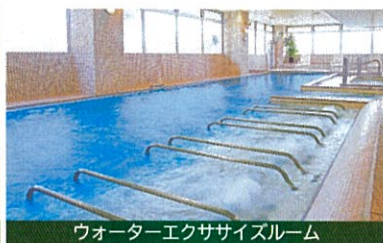
ウォーターエクササイズルーム